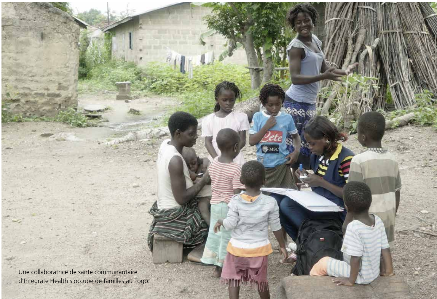
Une collaboratrice de santé communautaire d'Integrate Health s'occupe de familles au Togo.